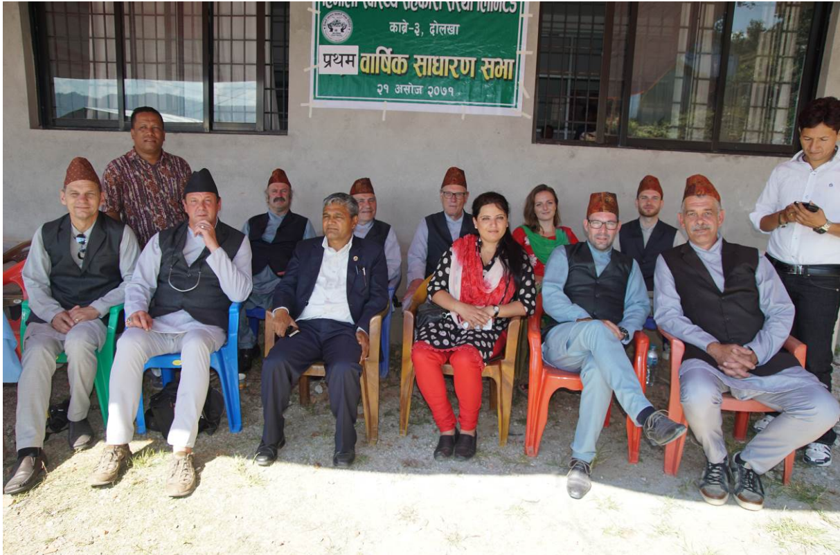
Foto projectbezoek n.a.v. 1 jarig bestaan Himalayan Care Hands ziekenhuis (bestuursleden met donateurs uit België en Nederland)

De economische status van de mensen in het Dolakha district staat hen niet toe om in geval van ziekte een ziekenhuis in Kathmandu te bezoeken. In noodgevallen hebben mensen al minstens NR 10.000 (€ 80,-) nodig voor een ambulancerit. Daar komen de kosten voor een doktersconsult, onderzoek en medicatie nog bij. Dit is letterlijk onbetaalbaar. Daarom geven de meeste mensen uit de regio er de voorkeur aan om onbetrouwbare, onvoorspelbare en meestal traditionele geneeskundigen te bezoeken. In veel gevallen kunnen eenvoudige en goed te genezen ziektes of infecties hierdoor verergeren en zelfs tot de dood leiden.