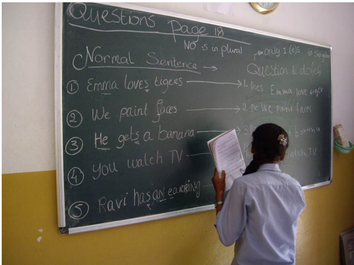
Foto 1: International Youth Award Nederland op werkbezoek. Engelse les en workshops HIV 2014.