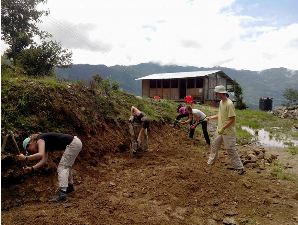
De Nederlandse jongeren van de Aard groep in Mainapokhari: bouwen keermuur.