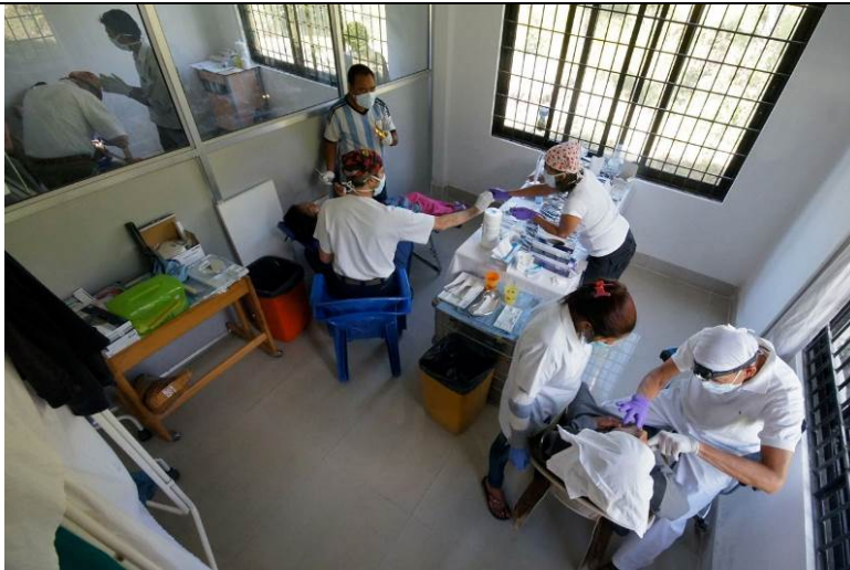
Foto: Tijdelijk tandartskamers ingericht in kliniek van HCH