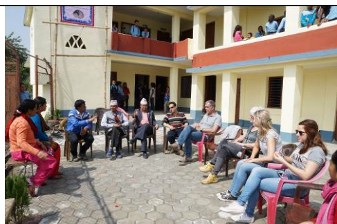
Bal Bikash school maart 2014