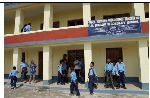
Bal Bikash school maart 2015