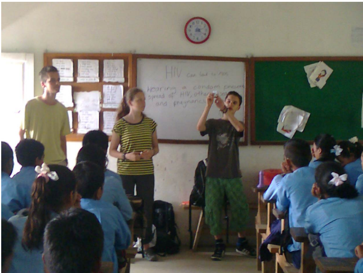
Uitleg over nut en gebruik van een condoom (HIV workshops Kavre school en Hanumanteshwor higher secondary).

De groep is tijdens hun verblijf ondergebracht bij een bankgebouw dat dienst doet als hotel. Er werd zelf gekookt. Aan het einde van het programma heeft een groot uitwisselingsfeest plaatsgevonden met alle leerlingen van de school waarbij wederzijds kennisgemaakt is met de verscheidenheid aan tradities. Bijzonder initiatief is het zogeheten Himali Health Care Fund waarin door de groep een bedrag van ruim 1.000 is ingezameld om voor kansarme mensen uit de streek gezondheidszorg mogelijk te maken.