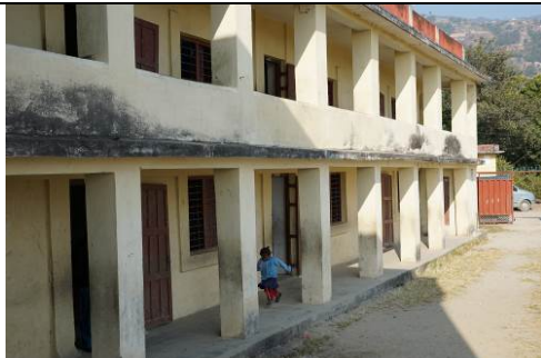
Bal Bikash school december 2014

Update: in 2015 is het hoofdgebouw en de lokalen opnieuw geverfd, zijn de toiletten weer gangbaar gemaakt, de bibliotheek opgeknapt en nieuwe lesmaterialen aangeschaft.