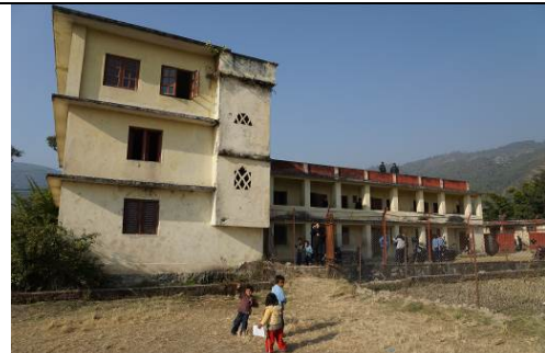
Bal Bikash school december 2014