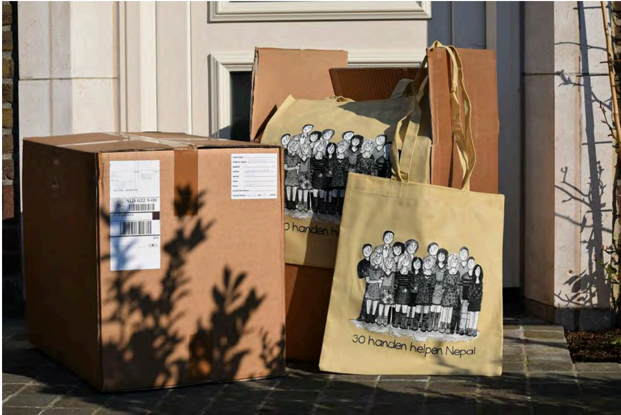
foto 6: een van de acties van de Jeugdkring Chrisko, het vervaardigen en verkopen van boodschappentassen

De Chaula Narayan School kon in 2016 rekenen op wel heel veel belangstelling en steun. Het is een schooltje ten oosten van Kathmandu in het stadje Thali. Het is een kleine school van de lokale Village Development Comité met 45 kinderen en onbruikbaar door de aardbeving. Nu krijgen ze les in voormalige veestallen. De oude school is een spookgebouw, geen glas in de ramen, geen deuren, een lemen vloer en nergens pleisterwerk. Een ander groot probleem is de armoede, waardoor de kinderen geen eten en drinken op de school kan worden aangeboden. Ook van huis nemen ze zelden iets mee. De kinderen van de Chaula Narayan School behoren tot de laagste kasten die in Nepal in relatieve armoede verkeren. De ouders zijn doorgaans niet in staat het weinige geld dat opgebracht moet worden voor schoolkleding, spullen en de lunches op school te bekostigen. De leerkrachten op hun beurt krijgen maar een schamel salaris, maar bekommeren zich met groot enthousiasme om de kinderen. Er is geen geld, er zijn geen boeken, geen bruikbare schoolborden.