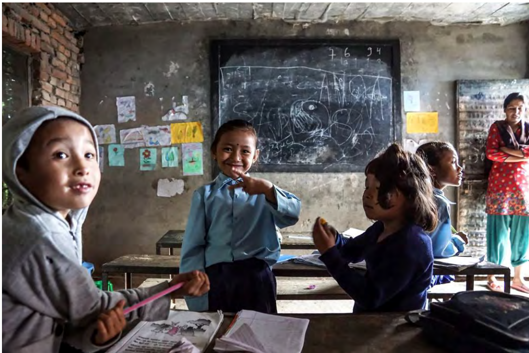
foto 10 Thali school.

De overige boekingen betreffen de in dit jaarverslag beschreven projecten.