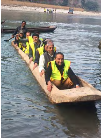
foto 2 Moeilijk te bereiken Sindhupalchowk