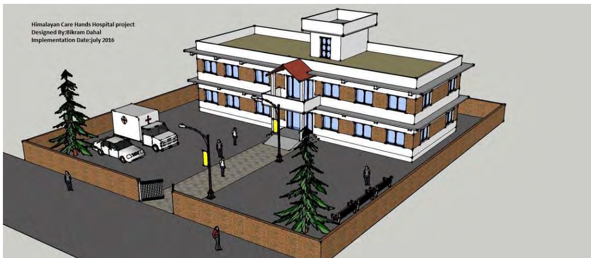
foto 4 Bouwtekeningen uitbreiding HCH ziekenhuis

In 2015 heeft Wilde Ganzen onze uitbreidingsplannen goedgekeurd voor een eerste verdieping en de aanschaf van een ambulance. Daarmee is een bedrag gemoeid van € 78.000 waarvan € 50.000 als bijdrage van onze stichting, Wilde Ganzen en andere Nederlandse en Belgische donateurs. Het resterende deel van de benodigde budget wordt door de lokale vereniging bekostigd. In 2016 is begonnen met de bouw van de eerste etage.