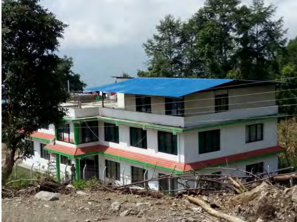
Foto 5 Zijaanzicht kliniek in september 2017

De huidige staf (N=11) bestaat, naast de dienstdoende arts (general physician) en twee senior health assistants, drie verpleegkundigen, een laborante, een radioloog en een apotheker die 24/7 beschikbaar zijn. Daarnaast een ambulance chauffeur en twee toezichthouders