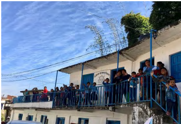
Foto 8: De nieuwe afrastering voor veiligheid van de kinderen aan het hoofdgebouw (2017)