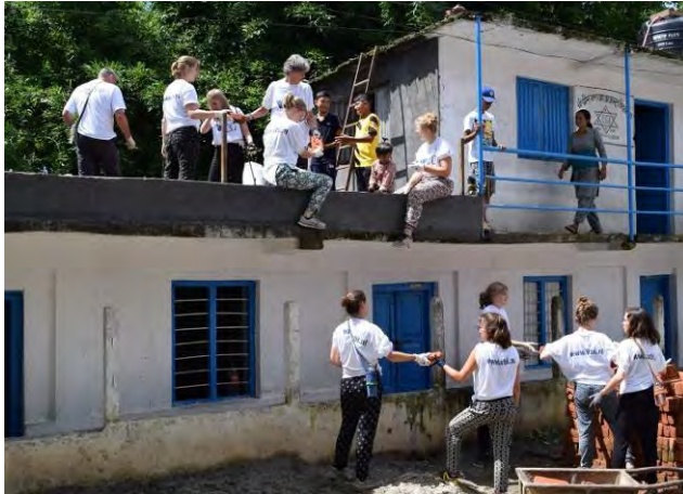
Foto 10 De vrijwilligers van jeugdkring Chrisko

puinruimen, funderingen leggen, verven, stukadoren, timmeren en lesgeven behoorden tot de werkzaamheden waar de groep vrijwilligers, samen met de mensen uit Thali zelf, zich gedurende deze eerste reis vol overgave op hebben gestort.