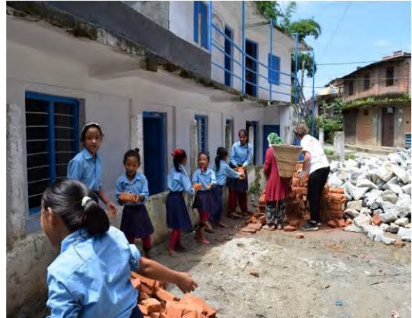
Foto 11 Ook de scholieren helpen mee aan hun school

Dit project heeft niet alleen bijgedragen aan de heropbouw van de school voor de allerarmsten in Thali. Er zijn nog andere effecten geweest van de Helpende Handen in Nepal: er is ook een fundament gelegd voor de Engelse lessen van de kinderen van het schooltje. Engels is een essentiële taalvaardigheid als je als Nepalees verder wil komen dan je eigen dorp. Verder heeft de groep van Jeugdkring Chrisko geprobeerd een brug te bouwen tussen de plaatselijke bevolking en andere kinderen die een private school kunnen bezoeken en de kinderen die naar het lokale schooltje gaan, in die zin dat zij de Engels sprekende jeugd van de hogere kaste hebben betrokken bij de bouw van de school voor de armere kinderen.