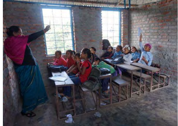
Foto 8 Les is voormalige veestallen