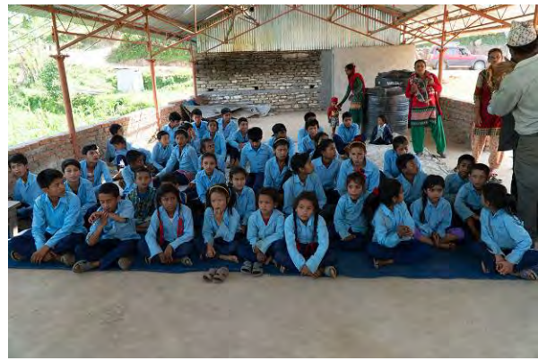
Foto 16 De scholieren in de geïmproviseerde school.