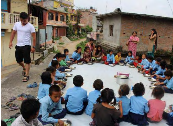
Foto 7 De schoolkinderen tijdens de lunch op het dak van het schoolgebouw