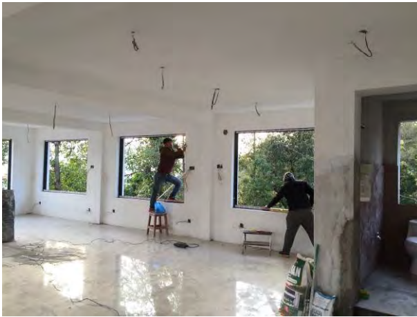
Foto 3 Schilderwerk eerste verdieping

drastisch te laten dalen door toegang tot medische begeleiding te faciliteren. Na de bouw heeft de stichting - terecht - gesteld dat de overgang van een kraamkliniek naar een algemene kliniek een betere stap is, om te voorkomen dat andere patiënten alsnog van de toegang tot medische zorg verstoken blijven. Een volledig ingerichte kraamkliniek biedt immers al zo'n 80 procent van wat er nodig is voor algemene (basis-) gezondheidszorg. Daarom is er in gezamenlijk overleg besloten er een algemene kliniek van te maken, met een focus op supervisie, preventie en interventie tijdens zwangerschappen en moeder- en kindzorg. Men kan nu dus ook terecht voor algemeen onderzoek, bloedonderzoek en röntgenonderzoek en daarbij horende (niet-chirurgische) behandelingen.