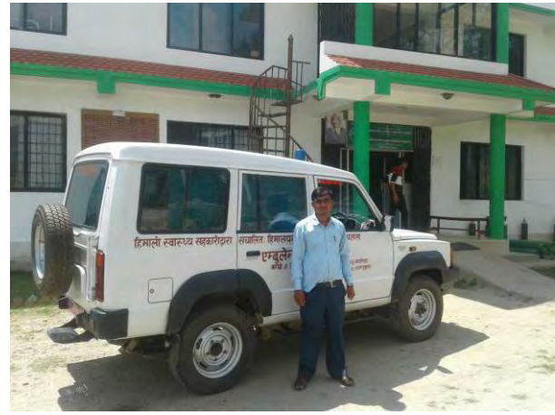
Foto 4 Eigen ambulance

Bij de aanvankelijke plannen kon geen inschatting gedaan worden van het aantal patiënten, als referentie waren enkel de 700 bevallingen. Tussen oktober 2013 en maart 2014 bedroeg het gemiddelde aantal patiënten 150, intussen is dit gemiddelde in 2017 gestegen naar 400 patiënten (leeftijd 15-70 jaar) per maand. Het aantal gecompliceerde bevallingen is gestegen en bedraagt circa 90 per jaar. De belangrijkste reden is de cultuuromslag waarbij meer vertrouwen ontstaat in professionele hulp onder de doorgaans argwanende Hindoeïstische inwoners die voorheen hun toevlucht zochten in alternatieve geneeskunde onder (be-)leiding van lokale sjamanen.