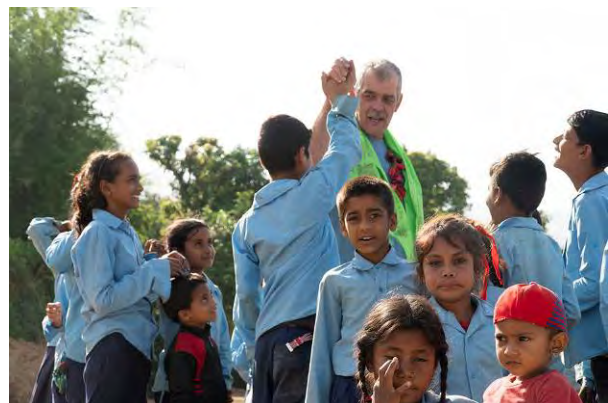
Foto 18 Scholieren verheugd over komst van de eerste Nederlander in hun dorp.