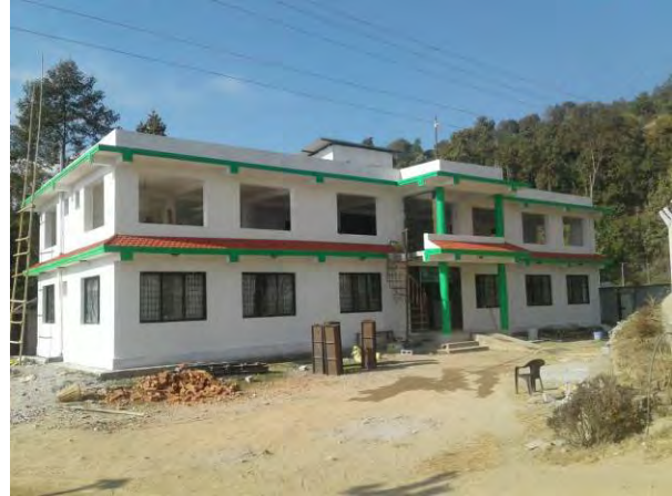
Foto 6 Vooraanzicht gehele kliniek september 2017