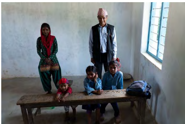
Foto 17: op lemen vloer lessen volgen en nauwelijks lesmaterialen.