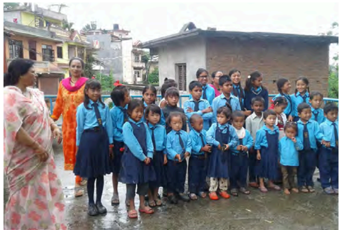
Leerlingen poseren op het dak van het hoofdgebouw in Thali.

Het nieuwe gebouw, dat in 2020 gereed moet komen, bestaat uit 5 klaslokalen, een docentenkamer, bibliotheek/pc/studieruimte en opslagruimte met sanitaire voorzieningen. Alle ruimtes zijn volgens de bouwtekeningen geschikt om primair dienst te doen als klaslokaal bij de verwachte stijgingen van leerlingenaantallen. Het land, de bouwgrond is intussen door de eigenaar geschonken aan de school op voorwaarde dat de bestemming school verwezenlijkt wordt. De Nepalese overheid heeft zich bereid verklaart om na verwezenlijking van het schoolgebouw zorg te dragen voor de werving en salariëring van de benodigde docenten en de school daarmee te erkennen als regulier onderwijs.