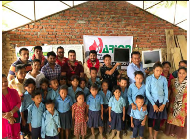
Foto: laptops en pc's voor lagere scholen in het afgelegen Lalbandi in Terai