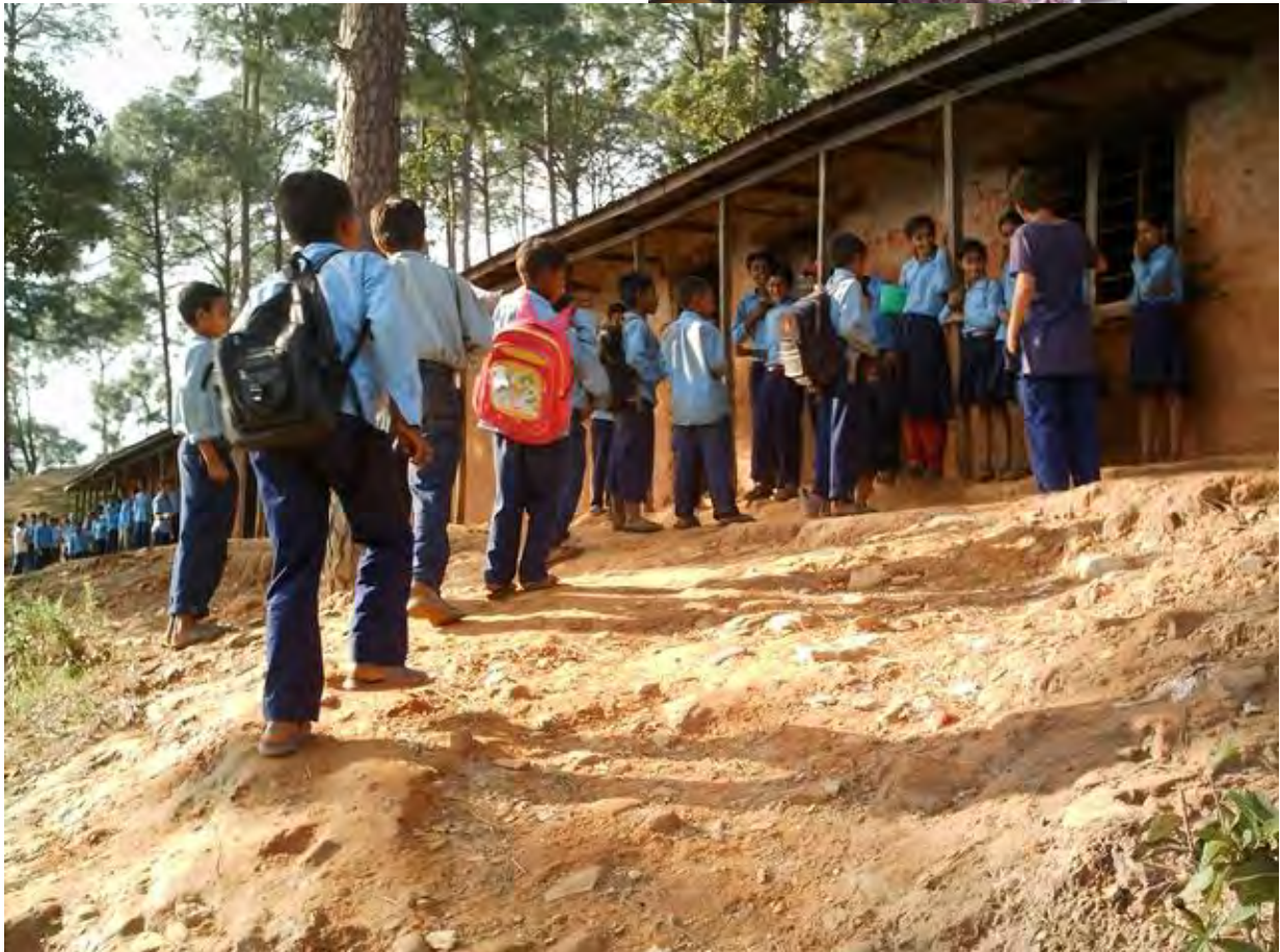
Shree Shankha Devi schoolproject van de stichting Hulp aan Nepal in Jemrung

In juni zijn de stichtingen Hulp aan Nepal ( http://www.hulpaannepal.nl/nepal/ ) en Himalayan Care hands de samenwerking aangegaan om de krachten te bundelen. Aanleiding is dat de stichting Hulp aan Nepal zichzelf gaat opheffen en haar financiële nalatenschap wil overdragen aan een vergelijkbaar opererende stichting voor Nepal.