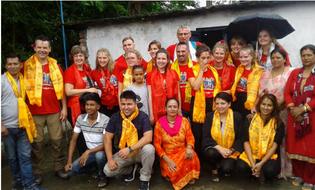
Foto: Jeugdkring Chrisko in 2019 voor de vierde keer in Nepal om de grond bouwrijp te maken voor het nieuwe schoolgebouw. Samen met leerkrachten en bestuursleden van HCH Nepal.