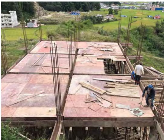
Eind 2019 worden de contouren zichtbaar van het nieuwe schoolgebouw in Thali

Het zogenoemde secondary onderwijs (algemeen voortgezet onderwijs) duurt in Nepal drie jaar. Het is een goede voorbereiding op beroepsonderwijs waarmee de benodigde kwalificaties voor de arbeidsmarkt verworven kunnen worden. Wij vinden dat deze kans ook voor de scholieren van de Chaula Narayan school binnen bereik moet komen. Veel kinderen zijn talentvol en verdienen een kans zich te kunnen ontplooien. We zijn daarover in gesprek gegaan met de community en de schoolleiding. Daaruit is het plan geboren om de basisschool uit te breiden met drie jaren vervolgonderwijs, op dezelfde wijze en onder vergelijkbare condities als thans het geval is. Dit slaat de brug naar mogelijkheden voor een startkwalificatie om deel te nemen aan beroepsonderwijs of in ieder geval voldoende algemene kennis te verwerven die meer mogelijkheden biedt in de samenleving dan wanneer ze op zeer jonge leeftijd schoolverlaters worden.