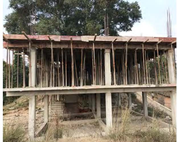
De bouw van het twee verdiepingen tellende schoolgebouw.